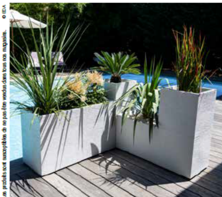
Les produits sont susceptibles de ne pas être vendus dans tous nos magasins.